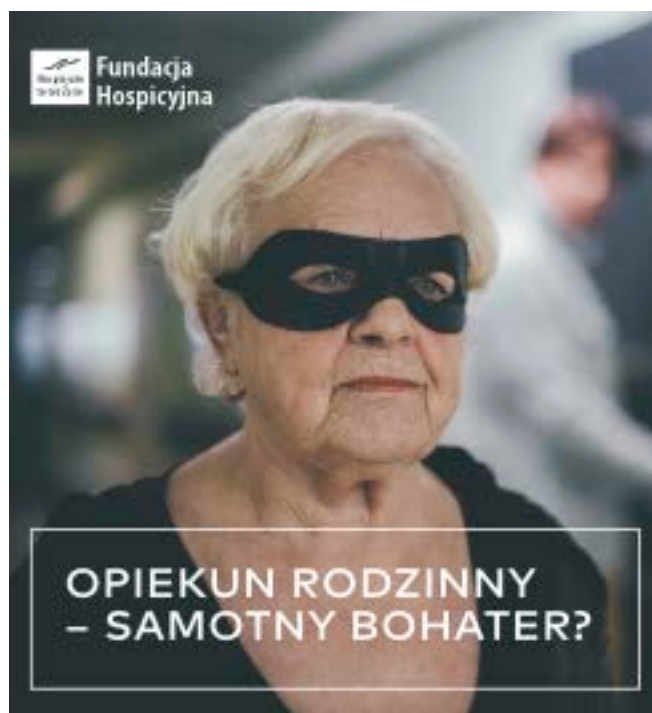
Mniejsza wersja plakatu – baner na stronę www