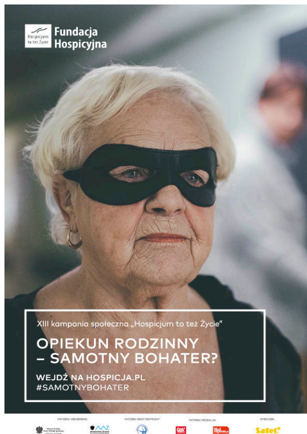
Plakat promujący akcję